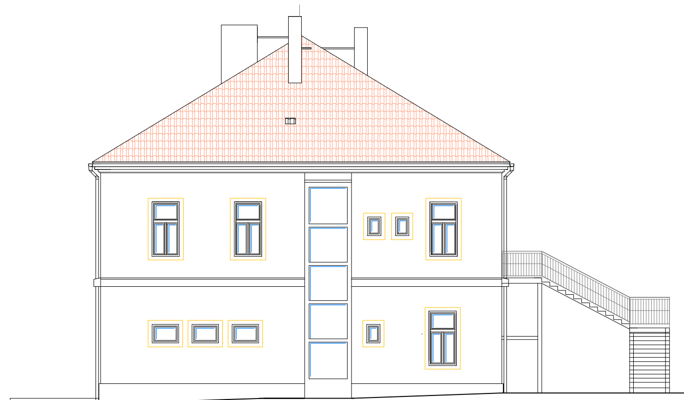
POHLED BOČNÍ – LEVÝ